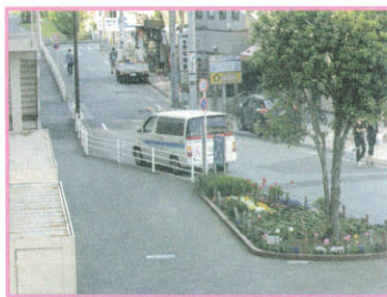
花壇よりも前方に停車している場合もあります。