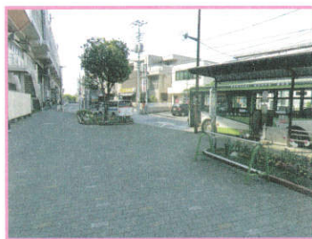
東口左側階段を下りた風景です。