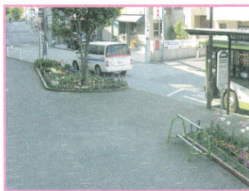
バス停の前が送迎車の停車位置です。